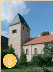
St. Gertrudis Hedersleben