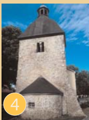
Alte Kirche Bad Suderode

Als Gotteshaus wird die Kirche in der Schulstraße des Kurortes nicht mehr genutzt. Das älteste Gebäude in Bad Suderode ist ein Ort der Künste. Hier finden Ausstellungen und Konzerte statt. Der Bau stammt aus dem 10./11. Jh. Ende des 16. Jh. wurde das Kirchenschiff umgebaut. Im romanischen Triumphbogen sind spätromanische Fresken erhalten.