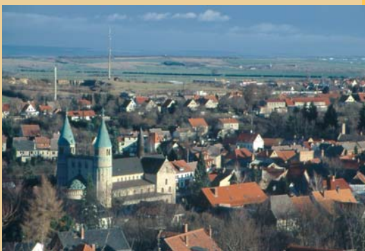
Blick auf Gernrode