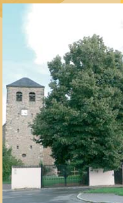
Winterlinde vor St. Andreas

Thale-Information in der Rathausstraße 1 ☎ (03947) 2597 www.thale.de