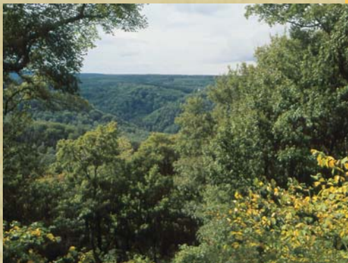
Selketalblick von der Burg Anhalt

Nach dem Aussterben der Ottonen übernahmen von 1024-1125 die Kaiser aus dem fränkischen (salischen) Hause die Macht im Deutschen Reich. Auch sie bevorzugten den Harz mit seinen Randgebieten als Sitz und Basis der Reichsgewalt. Zur Sicherung der Zentralgewalt des Kaisertums wurden im Harzgebiet mächtige Burgen gebaut, doch im doppelten Konflikt mit den sächsischen Fürsten und mit dem Papsttum (Investiturstreit) war letztlich die Zentralgewalt unterlegen. HEINRICH V. (1086-1125), der nach der vernichtenden Niederlage in der Schlacht am Welfesholz 1115 gezwungen war, sich mit dem sächsischen Adel zu versöhnen, beendete 1122 den Investiturstreit mit einem Kompromiss (Wormser Konkordat). Als er kinderlos starb, endete auch die Dynastie der Salier. In der zweiten Hälfte des 12. Jh. kam es zu Auseinandersetzungen zwischen Kaiser FRIEDRICH I. (genannt Barbarossa, um 1122-1190) und dem Welfenherzog HEINRICH DEM LÖWEN (1129-1195). Da Barbarossa die Mithilfe der Fürsten benötigt hatte, um den Welfen niederzuwerfen, musste er Zugeständnisse machen; das Gebiet des Harzes wurde in zahlreiche weltliche und geistliche Territorien aufgeteilt. Besonders die Harzgrafen befehdeten sich untereinander. Anfang des 13. Jh. verloren die Grafen das Befestigungsrecht, es ging an den nichtgräflichen freien Adel über. Am Ende der Romanik gewinnt die Stadt zunehmend an Bedeutung. Mit der Entwicklung der Städte und des Handels verändert sich auch die Kunst – die Gotik löst die Romanik ab.