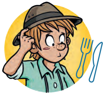
Wer frisst wen?

Schneide Henry und alle Tiere aus. Ordne die Tiere zu einer Nahrungskette an und klebe sie in richtiger Reihenfolge unten in die Mitte deines Lapbooks. Male Maus, Fuchs und Hundertfüßer aus.