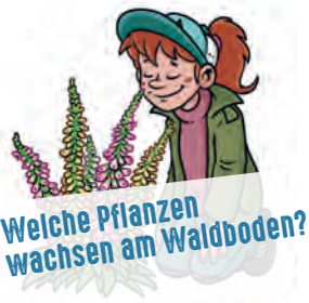
Welche Pflanzen wachsen am Waldboden?

Schneide die ganze Bilderleiste aus, falte es an jeder weißen Bildkante abwechselnd nach vorn und hinten. Auf die Rückseite vom Pilz machst du Kleber und klebst es in dein Lapbook.