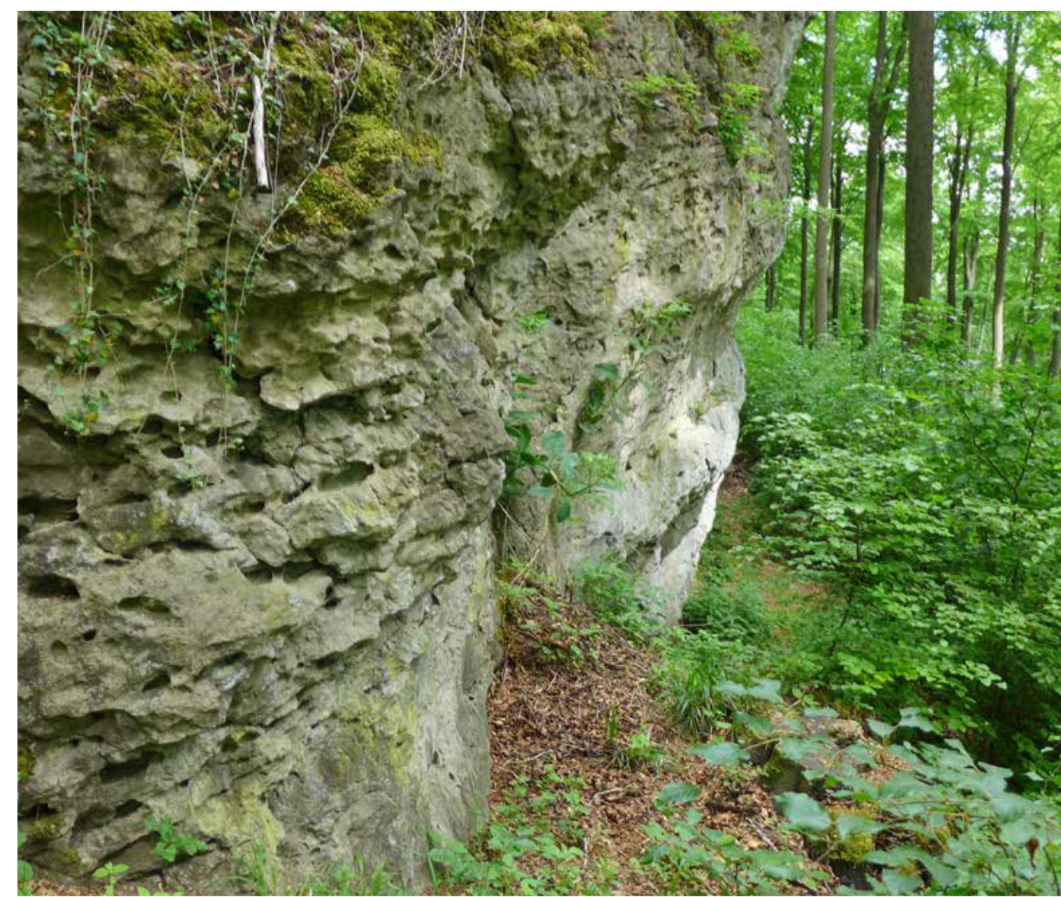
Kalksteinfelsen am Südhang des Kahlbergs bei Dögerode Limestone cliffs on the southern slope of Kahlberg Hill near Dögerode

Wer einen aufmerksamen Blick auf Tor- bzw. Zaunpfosten oder den Sockel vieler Häuser in Kalefeld wirft, dem fällt ein helles Gestein auf. Der im Ort verbaute Kalkstein stammt vom Kahlberg. Die Entstehungsgeschichte des Gesteins reicht zurück in die jüngste Epoche der Jurazeit vor etwa 155 bis 152 Mio. Jahren, als weite Teile Europas von einem flachen Meer überflutet waren. Im warmen Wasser kam es zur Ausfällung von Kalzit.