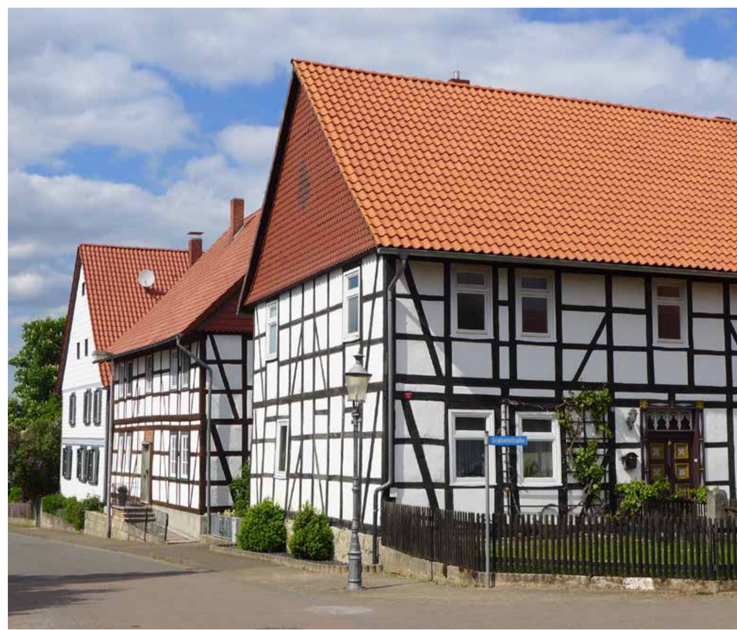
Fachwerk, Treppenaufgang und Zaun gründen auf Kalkstein The timber framework, staircase and fence are based on limestone

Ein weiterer Geopunkt des Geoparks im Gebiet der Gemeinde Kalefeld ist das Harzhorn. Dort lässt sich vermitteln, wie das Relief der Erdoberfläche die Entwicklung einer Region beeinflusst. Wer aus Richtung Göttingen durchs Kalefelder Becken nach Norden wollte, suchte den Pass zwischen Vogelberg (335,7 m über NHN) im Westen und Rodenberg bzw. Hohem Rott (323,6 m über NHN) im Osten, um sich Steigung bzw. Gefälle von mehr als 100 Höhenmetern zu ersparen. So entstand eine historische Handels- und Heerstraße, der heute die Bundesstraße 248 folgt.