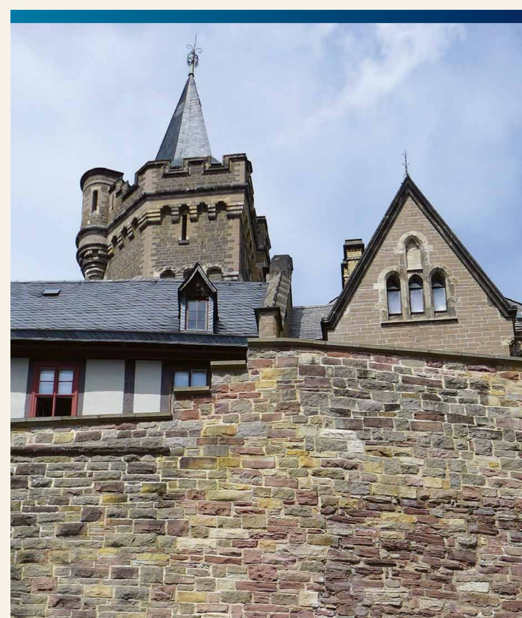
Gebrochene Steine im vorderen Mauerwerk, gesägte in Giebel und Turm

Ursprünglich thronte eine Burg auf dem Harzburgberg, ca. 1,5 km SSW von hier. Eine neue Burg ließen die Grafen von Wernigerode erst Mitte des 14. Jh. erbauen. Von dieser sind noch Spuren hier im heutigen Schloss zu finden. Nachdem das Geschlecht der Grafen von Wernigerode 1429 im Mannesstamm ausgestorben war, fiel die Herrschaft an Graf Botho zu Stolberg. Der jedoch residierte auf seinem Schloss im Südharz. Wernigerode war Nebenresidenz. Umfangreiche Baumaßnahmen gab es hier erst Ende des 15. Jh. Das dabei entstandene große spätgotische Gebäude ist bis heute nahezu komplett erhalten geblieben, erkennbar in der Nordseite von Schloß Wernigerode. Während des Dreißigjährigen Krieges fand mit dem Obristen Rubertus Viti ein Ire Erwähnung, der mit seiner Besatzung von 130 Mann fast alle Räume der in der ersten Hälfte des 17. Jh. arg heruntergekommenen Burg beanspruchte. 1674 und 1676 ließ der in Ilsenburg residierende Graf Ernst zu Stolberg dann Erneuerungsarbeiten hier auf dem Agnesberg ausführen, in Fachwerkbauweise. Eine Schlossanlage entstand jedoch erst zur Zeit des Barock. Graf Christian Ernst zu Stolberg-Wernigerode hatte die Hofhaltung von Ilsenburg nach Wernigerode zurückverlegt. Er regierte die Grafschaft Wernigerode von 1710 bis zu seinem Tode 1771. Im Jahr 1714 musste die Brandenburgische Oberhoheit anerkannt werden. Dennoch, mit Ausnahme weniger Rechte des Königs von Preußen, blieb die Wernigeröder Souveränität bis 1876 weitgehend erhalten.