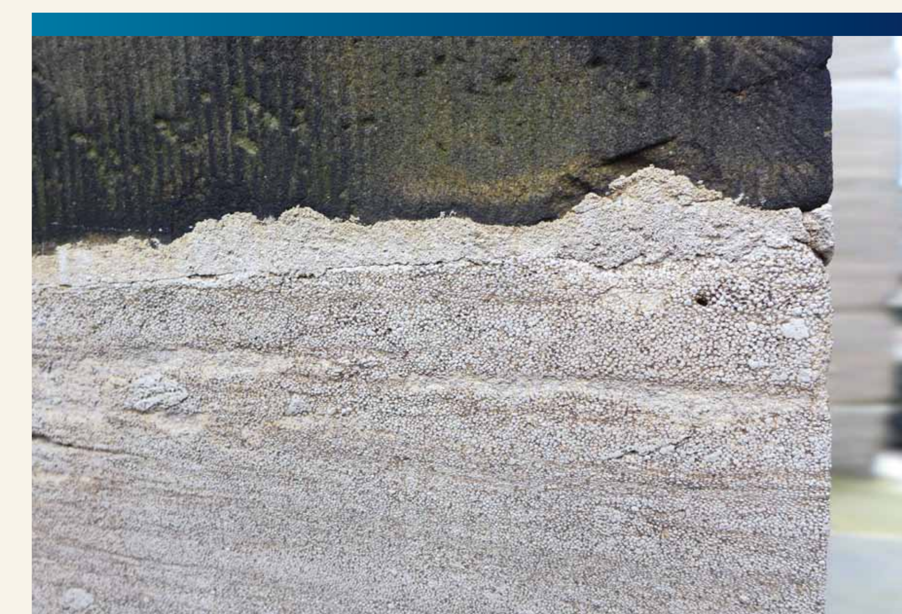
Rogenstein gesägt (great oolite sawn)

Rogenstein entstand vor mehr als 249 Mio. Jahren in einem warmen und salzhaltigen Meer. Er besteht aus winzigen Kalkkugeln, die ihrer Form nach an Fischrogen erinnern. Auch Muschelkalk und Sandstein wurden verbaut. Gewonnen wurden sie alle in Steinbrüchen im Gebiet der Aufbruchzone des nördlichen Harzvorlandes. Während der Heraushebung des Harzgebirges waren dort Sedimentschichten steilgestellt worden. Ursprünglich überdeckten diese selbst den Granit des Brockens sowie die Grauwacke des Agnesberges. Für die Ringmauern und aufgehendes Mauerwerk der Gebäude, fand Grauwacke ebenso Verwendung wie schwarze Vulkanite des Harzgrundgebirges. Das Alter der verschiedenen Gebäudeteile ist gut an den Außenflächen der Naturwerksteine zu erkennen. In frühen Bauphasen