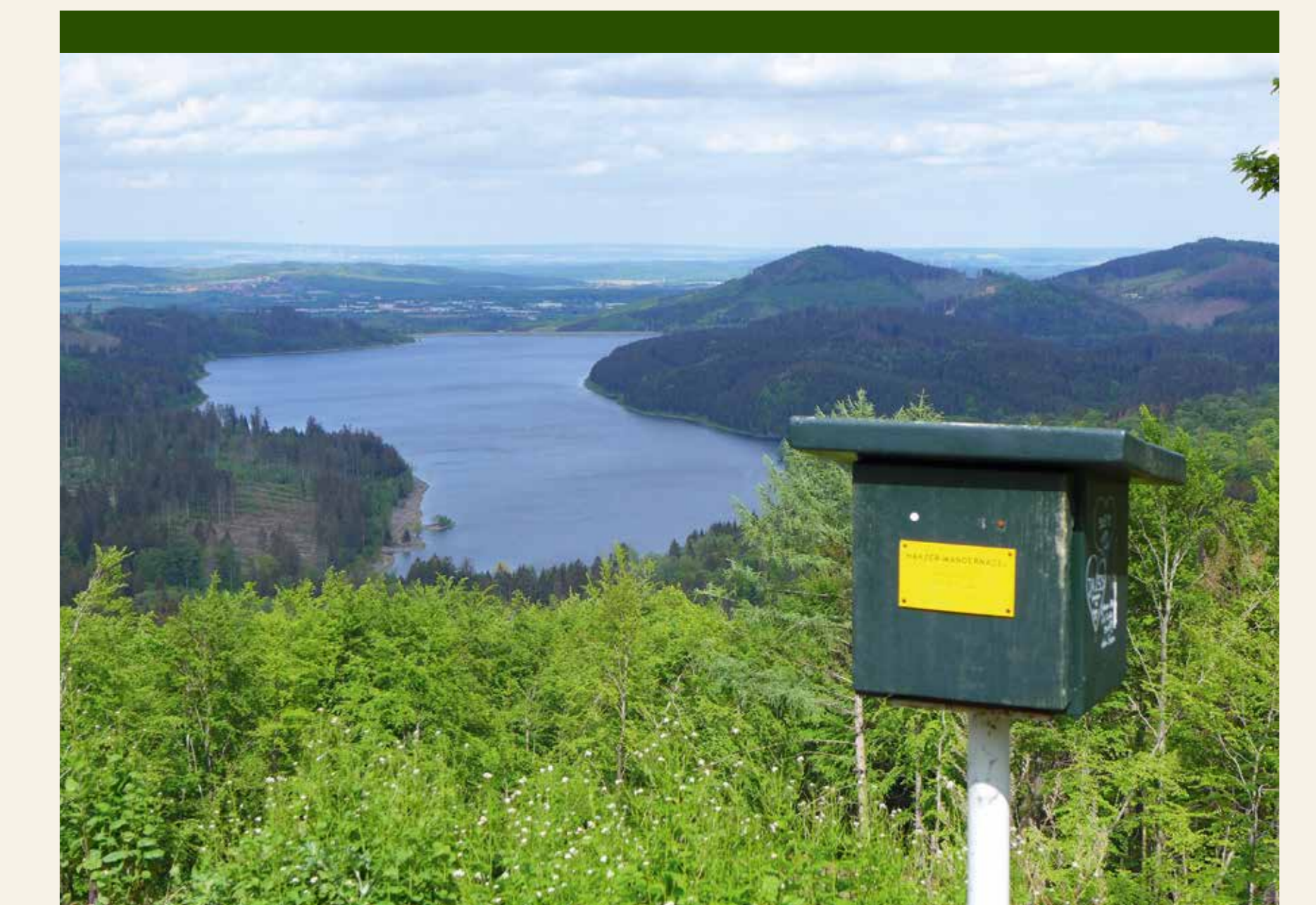
Blick auf den Granestausee von der Altarklippe