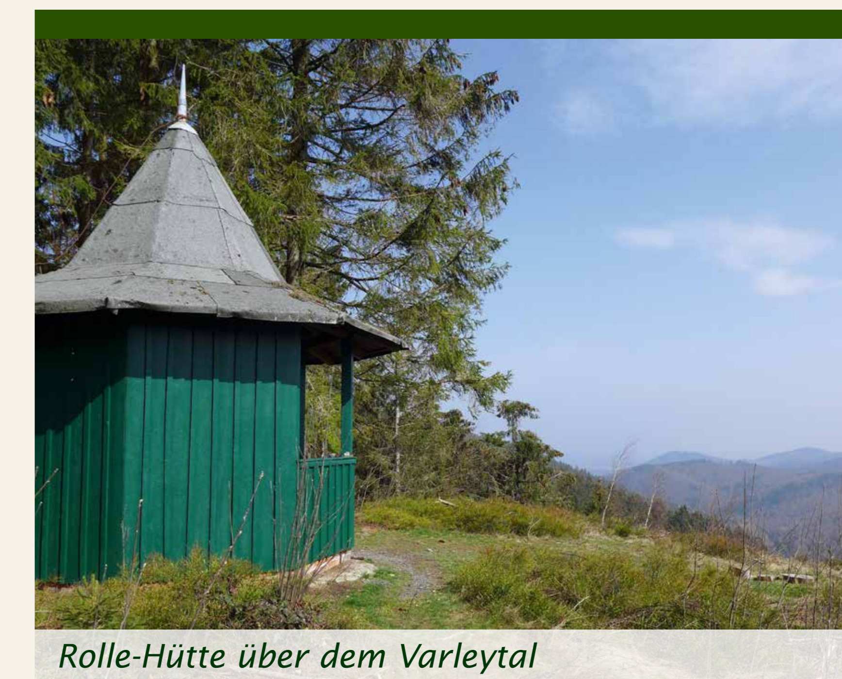
Rolle-Hütte über dem Varleytal

hatten jene Frauen aus Wolfshagen zweimal täglich zu bewältigen, die mit ihrer Arbeitskraft und ihren Waren das Aufblühen des Fremdenverkehrs als neuem Wirtschaftszweig in Hahnenklee überhaupt erst ermöglichten. Los ging es für sie mit dem Aufstieg unter erschwerten Bedingungen: auf dem Rücken eine Kiepe mit allem, was Gäste begehrten.